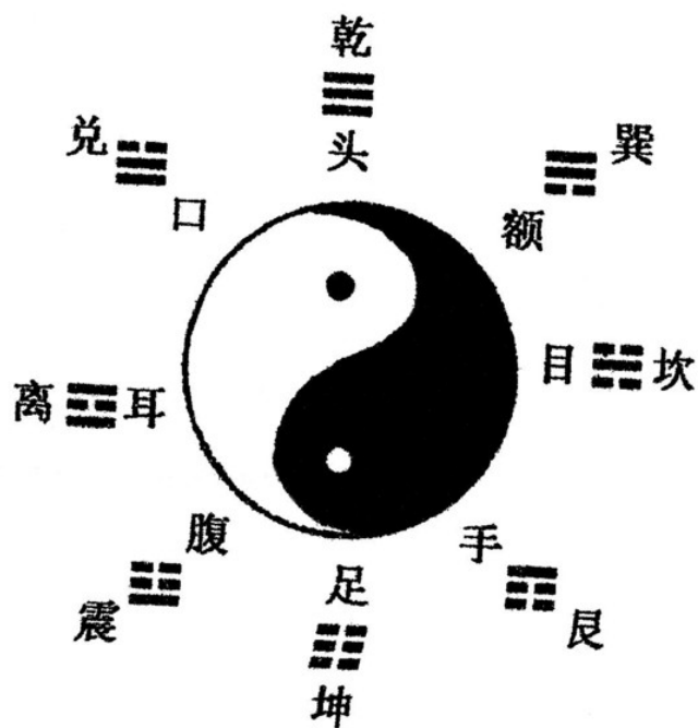
Abbildung 1: Hetu Karte Nabel